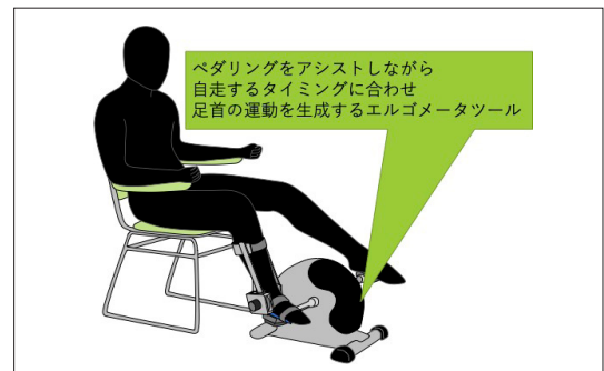
協調性を利用したリハビリテーションツール例

健康寿命の延伸や要介護状態の予防には、加齢や病気の後遺症があっても、転ばずに歩き続けられる年齢（歩行寿命）を伸ばすことも重要です。歩行は脚の関節を巧みに動かして達成できる協調運動で、この協調性は加齢や脳卒中などの麻痺によって失われてしまいます。我々はこの脚運動の協調性を促すツールやアプリケーションを開発しています。