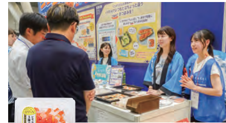
展示商談会でのPR活動

2024年度にマリンフーズ株式会社と学生が協働して開発した海鮮総菜「+IPPIN」シリーズの新商品開発に取り組みました。学生たちはアイデアと栄養学の知識を活かし、マリンフーズ社員様の指導のもとでグループワークや試作を重ね、4つの商品案を完成させました。2025年度にはその中から「レモン香る3種の海鮮ポキ」の商品化が決定し、展示商談会でのPR活動などを経て、スーパー等で販売されています。