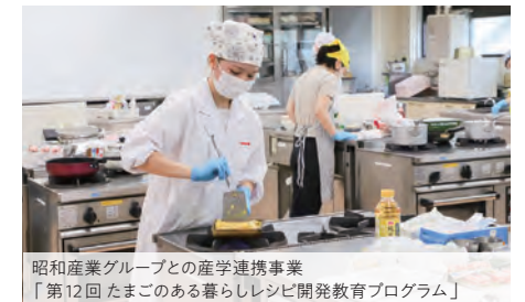
昭和産業グループとの産学連携事業 「第12回 たまごのある暮らしレシピ開発教育プログラム」

→ TEL: 03-3961-5274 E-mail: hulip@tokyo-kasei.ac.jp URL: www.tokyo-kasei.ac.jp/society/hulip/index.html