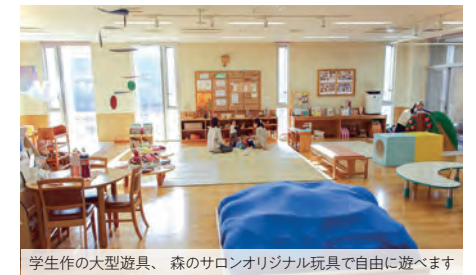
学生作の大型玩具、森のサロンオリジナル玩具で自由に遊べます

→ TEL: 03-3961-6354 E-mail: morinosalon@tokyo-kasei.ac.jp URL: www.tokyo-kasei.ac.jp/society/hulip/salon/index.html