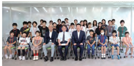
子ども大学学長(本学学長)と副学長(狭山市・入間市教育委員会教育長)を囲んでの入学式集合写真(狭山キャンパスラウンジ commonsにて)

狭山市・入間市の教育委員会と本学が実行委員会を組織し、地域の大学や市町村等が連携して子どもの知的好奇心を刺激し、学ぶ力や生きる力を育む学びの機会を提供し開催しています。今年15期を迎え、本学教員、地域専門家より「はてな学・ふるさと学・生き方学」の3つのキーワードにより、大学の特色を活かした教育プログラムを開発・実施しています。