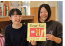
ニュージーランドの絵本の紹介

森のサロンでは、学生が企画するイベントを募集しています。2025年度は、グローバル教育センターと連携し、海外研修に参加した児童学科の学生2名が英語の絵本の読