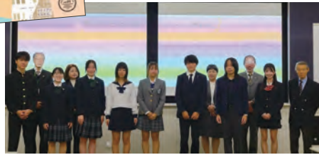
学園祭内で行われる表彰式には、全国から入賞校が集います。