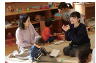
親子との対話を楽しむ様子

み聞かせと英語とマオリ語の手遊びの実践を行いました。学生は子どもたちの表情を感じながら、ジェスチャーを交え、ことばのリズムの楽しさを