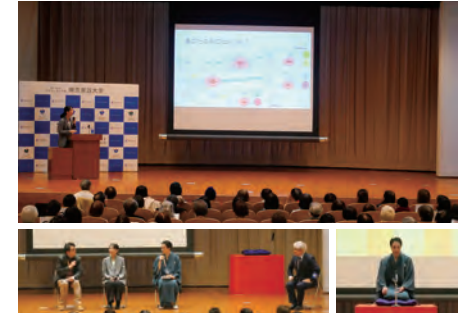
東京家政大学市民向け特別講座 2025

板橋区教育委員会との共催で「笑い」「健口」をキーワードとした市民向け特別講座「人生100歳時代をより良く生きるために～自分らしく健康に生きる秘訣～Vol.2」を開催しました。講師・進行は3名の本学専任教員と「笑いの実演・落語」で落語家さんをお招きし開催しました。最後のアフターミーティングでは全員で「ふり返し」「質問コーナー」で好評のうちに幕を閉じました。