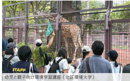
幼児と親子向け環境学習講座（北区環境大学）

→ TEL: 03-3961-2502 E-mail: rids@tokyo-kasei.ac.jp URL: www.tokyo-kasei.ac.jp/research/rids/index.html