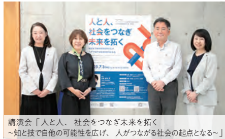
講演会「人と人、社会をつなぎ未来を拓く ～知と技で自他の可能性を広げ、人がつながる社会の起点となる～」

→ TEL: 03-3961-5305 E-mail: josei-mirai@tokyo-kasei.ac.jp URL: www.tokyo-kasei.ac.jp/research/woman/index.html