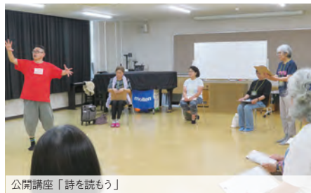
公開講座「詩を読もう」

→ TEL: 04-2955-6959 E-mail: chiiki@tokyo-kasei.ac.jp URL: www.tokyo-kasei.ac.jp/society/commulic/index.html