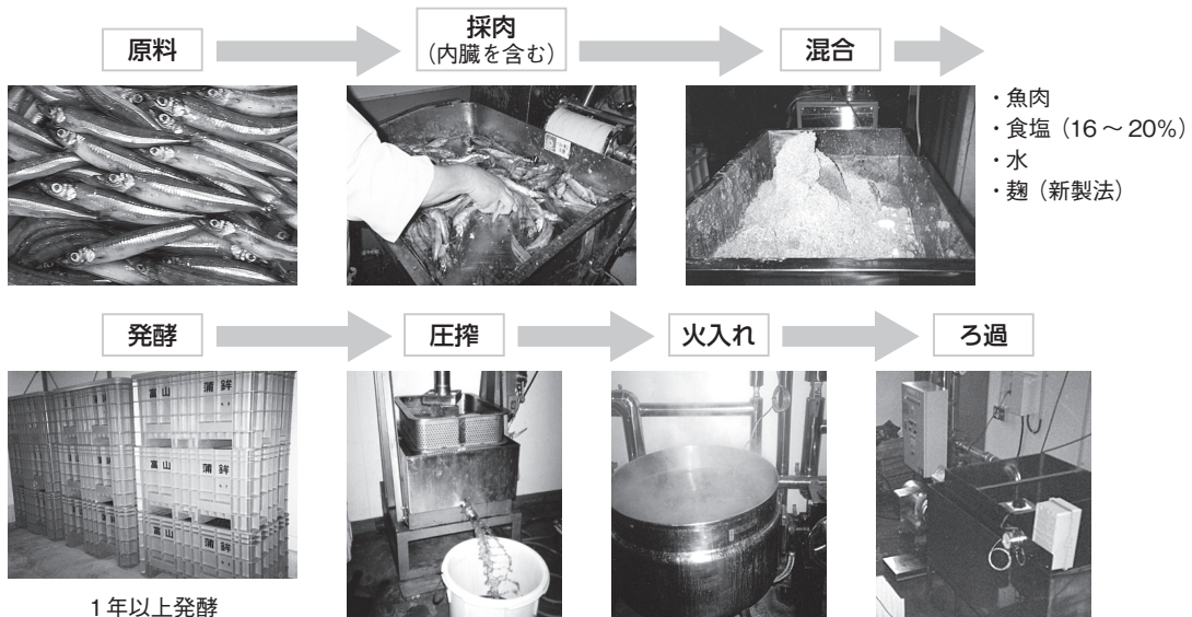
図1 麴添加型魚醤油製造法

伝統的な魚醤油の製造量は横ばいから減少傾向にあるが、麴などを添加して風味を改善した新規天然発酵調味料の製造量は増加している。背景として、消費者の嗜好の多様化、食の安心安全志向の高まり、低(未)利用魚や加工残滓の利用促進(リサイクル)などが挙げられる。最近の消費者の需要傾向としてはアミノ酸などの単独調味料に代わって発酵調