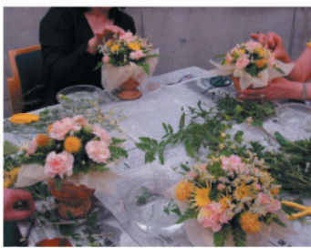
「楽しい花のある生活講座」

「ちょっとおしゃれにカリグラフィー」 西洋書道といわれるカリグラフィー。ハンドライティングの世界を楽しめます。 「今日から役立つ!簡単クッキング」 身近な旬の食材で簡単に作れる、いつもよりワンランク上のお料理をご紹介します。