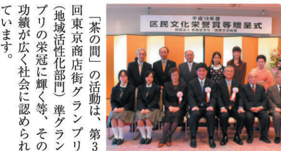
「茶の間」の活動は、第3回東京商店街グランプリ(地域活性化部門)準グランプリの栄冠に輝く等、その功績が広く社会に認められています。