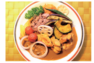
「大地の贈り物! ちょなグリルカレー」

営業時間（朝）6:45～9:00、（昼）11:30～14:00、（夕）18:00～21:30 栄養バランスを考えた食事をご提供しています。予約不要の食券制なので自炊と併用もできます。