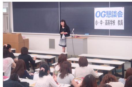
越谷市立城ノ上小学校教員

2010年3月卒業生の就職決定状況は学科により異なりますが、大学84～100%、短大93～98%と厳しい就職環境のなか学生は粘り強く頑張り、例年と大差なく高い決定率でした。取得資格や学んだことを生かす職業についてた者が多いことも本学の特色です。