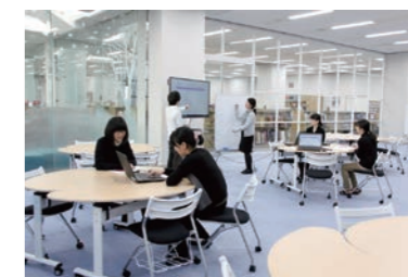
グループワークができる場として人気のLプラザ