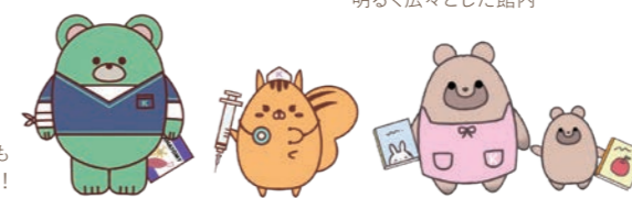
各学科にちなんだ狭山図書館キャラクターたちもボランティア活動から誕生しました！