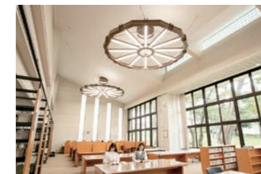
明るく広々とした館内