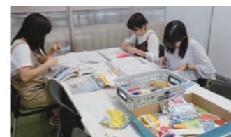
ボランティア活動では学年学科を超えた活動ができます

自分のペースで広がるつながり 活動内容や活動日について、学生中心に相談をしながらフレキシブルな活動をしています！ 他学科や先輩・後輩と一緒に活動することで仲間ができます。授業や他のサークル活動、アルバイトなどの都合に合わせて自由な活動を応援しています。