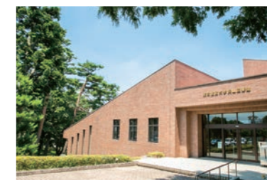
狭山キャンパスに映えるレンガの建物が狭山図書館です

学習も交流もかなう知の空間 狭山キャンパスの正門から入って右手にあるレンガの建物が狭山図書館です。多くの専門書と広々とした空間、グループワークができる多彩な場所、自分らしく学習できます。また余暇の時間にくつろいだり、ボランティア活動に参加するなど学生生活を充実させるヒントがたくさんあります！