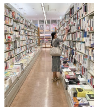
おすすめの本を書店に選びに行く選書ツアー企画も！