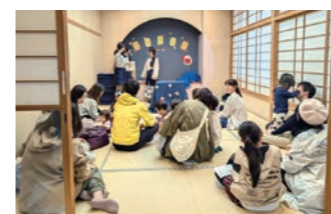
緑苑祭では、図書館2F和室にて読み聞かせを初開催！