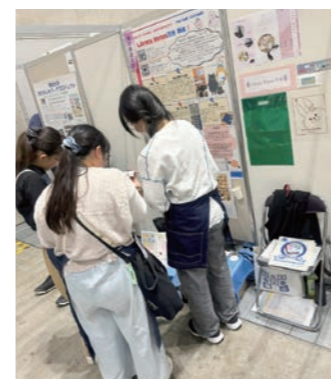
図書館総合展にて、他大学の学生と交流するLibrary Mates