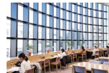
明るく落ち着いた館内