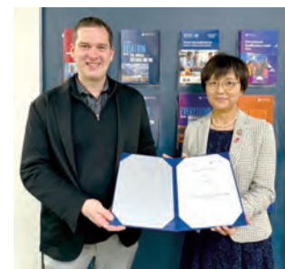
マッセイ大学国際部門 最高責任者の方と

さらには、スタディサプリENGLISH『Eフェスタ』で、中3学年が各単元にしっかり取り組み、その質と量において全国表彰を受けました。英語教育の成果が表れ、同時にますます学習に拍車がかかっていくことは、わが校の新たな伝統と言えるでしょう。今後も「家政から世界へ」はばたく人材を養成してまいりますので、学園そしてOGの皆様のご支援をよろしくお願い申し上げます。