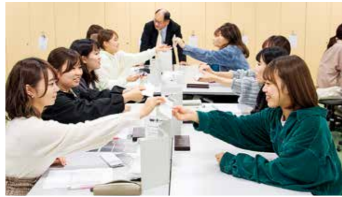
心理カウンセリング学科授業風景