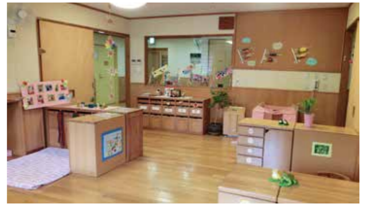
ナースリールーム新園舎保育室