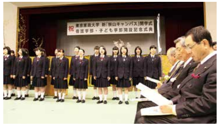
新狭山キャンパス開学式