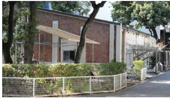
板橋校舎・煉瓦建物(22号棟)