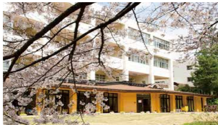
かせい森のおうち