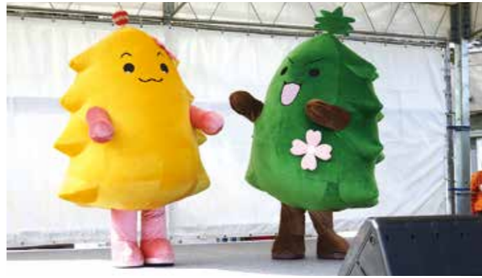
「かせいのモリタン」(右)「かせいのモリリン」(左)お披露目