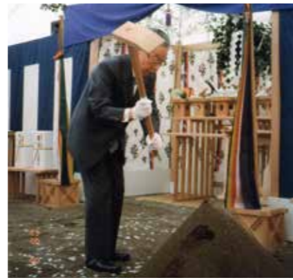
大学16号館新築工事 地鎮祭