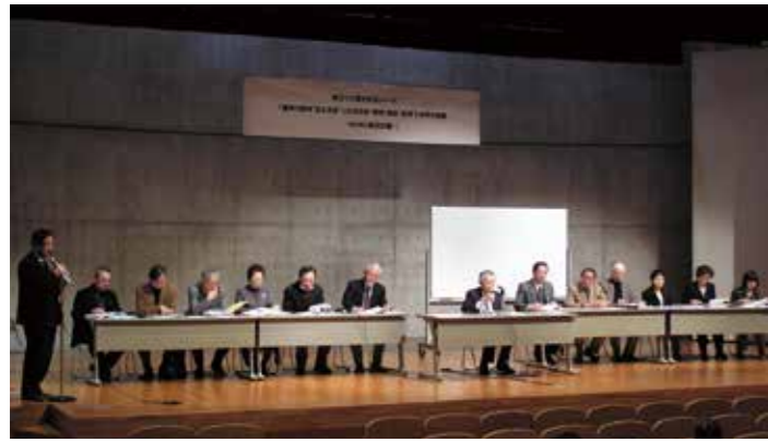
創立130周年記念シリーズ講演