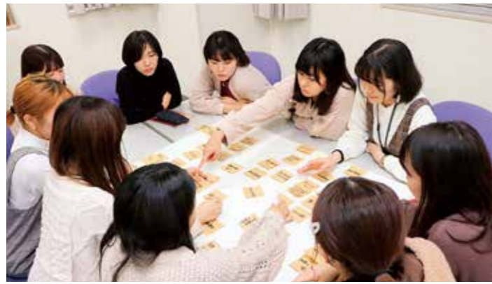
教育福祉学科授業風景