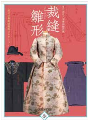
「裁縫雛形 渡辺学園裁縫雛形 コレクション」