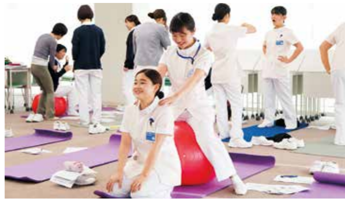
看護学科授業風景