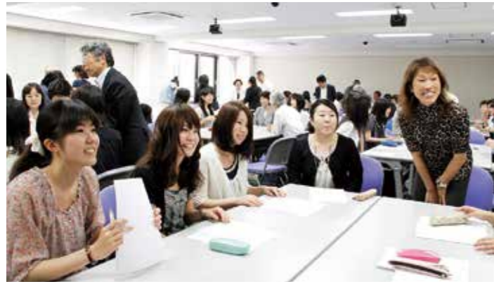
「在学生特待生奨学金」授賞式