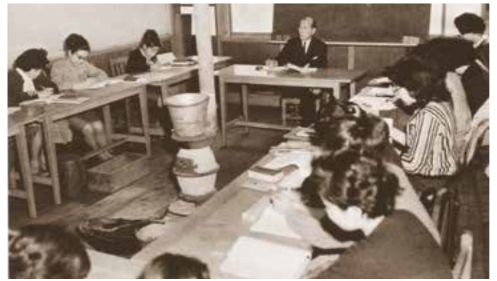
大学の授業風景(教室に当時の唯一の暖房器具である「だるまストーブ」が置かれている)