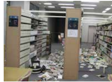
震災時の板橋図書館