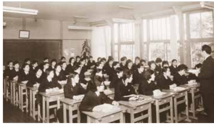
附属女子高等学校の授業風景