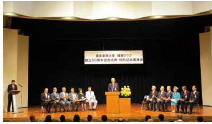
緑苑クラブ創立50周年式典