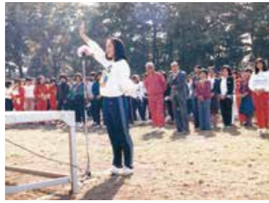
狭山校舎開学記念運動会