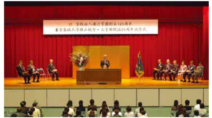
文学部開設20周年記念式