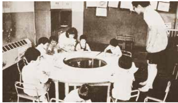
ナースリールームの保育風景