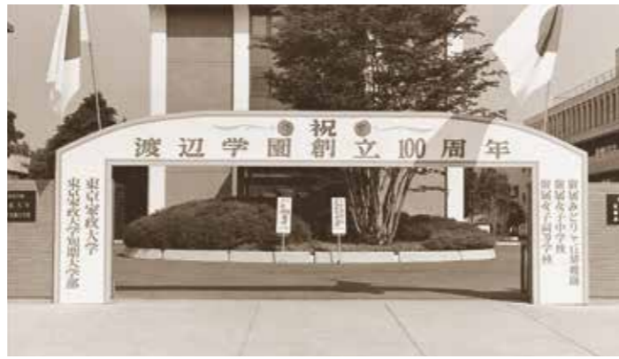
創立100周年記念式典当日の板橋校舎正面