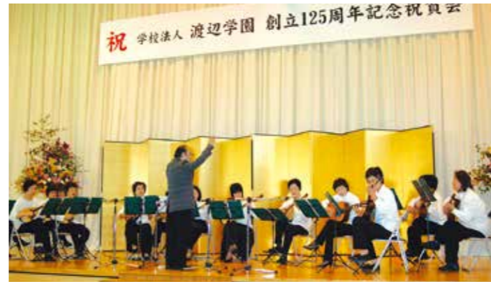
創立125周年記念祝賀会