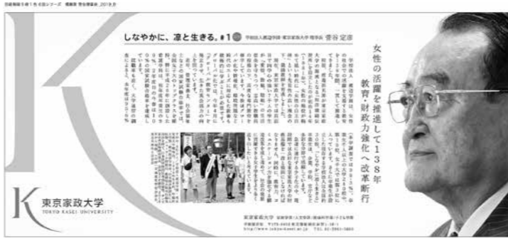
日本経済新聞 朝刊に 6週連続広告掲載