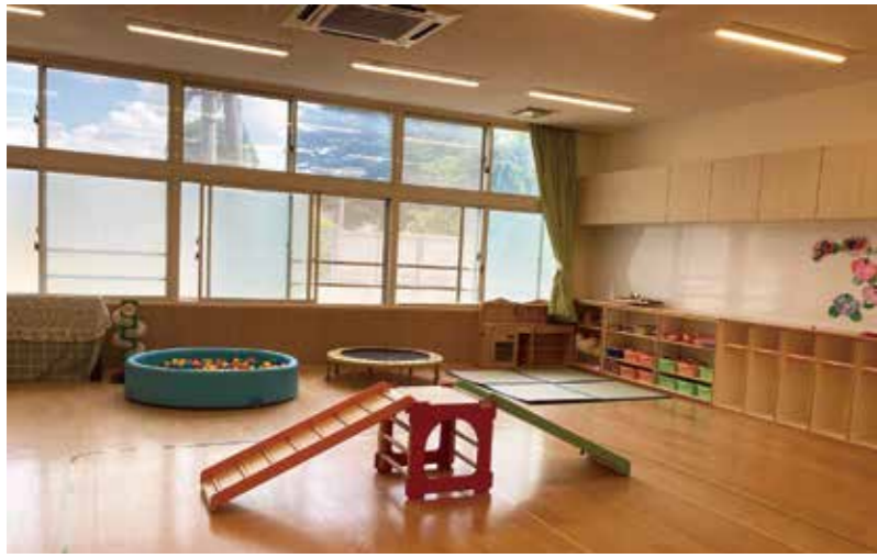
東京家政大学 児童発達支援事業所 わかかさ