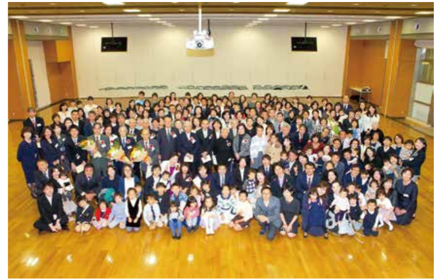
ナースリールーム50周年記念式典