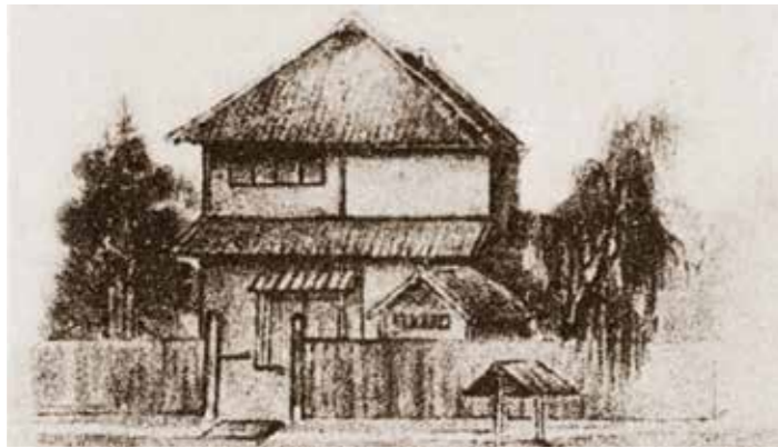
校祖・渡邊辰五郎が本郷湯島の自宅に開設した「和洋裁縫伝習所」校舎