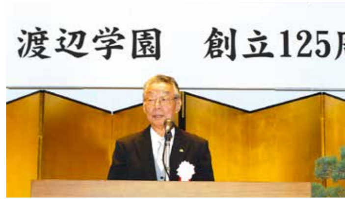
創立125周年記念式典