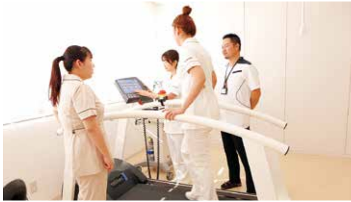
リハビリテーション学科授業風景