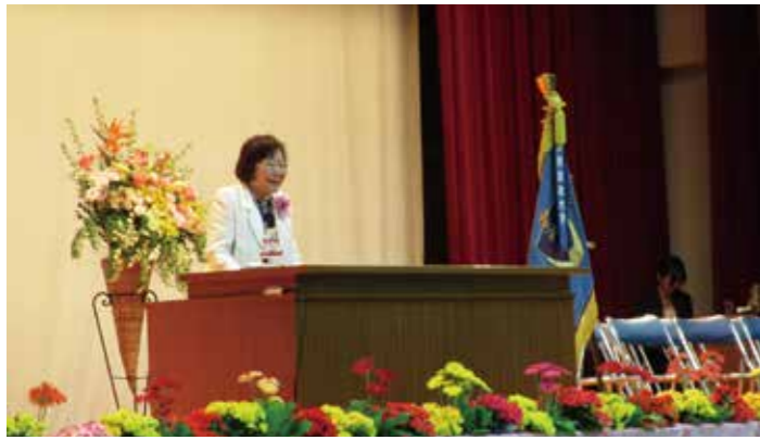
健康科学部への改組及びリハビリテーション学科開設記念講演