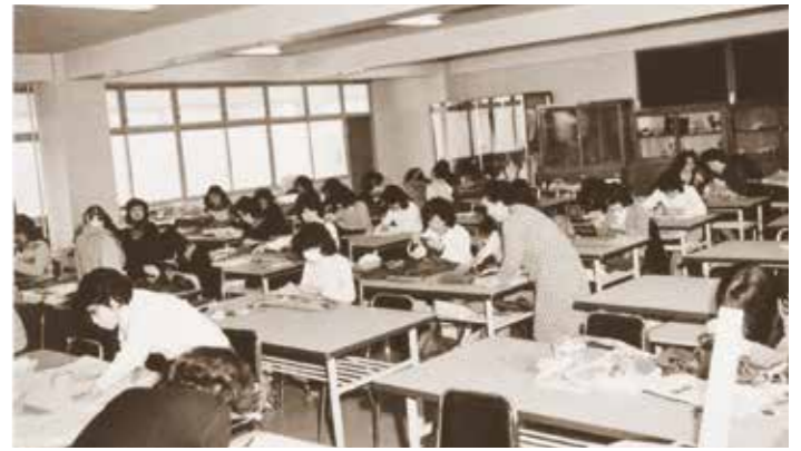
大学の授業風景「洋裁実習」