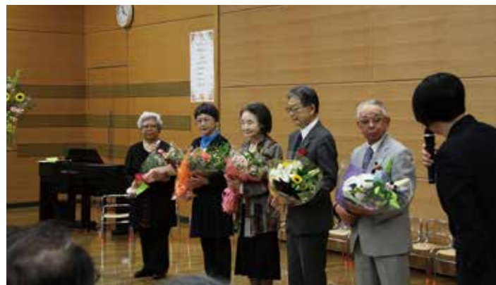
わかかさグループ創立50周年式典