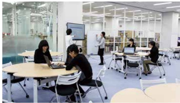
板橋図書館「Lプラザ」