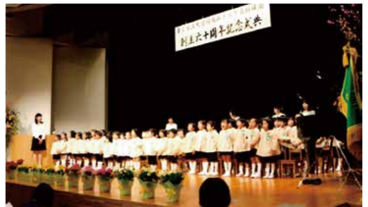
幼稚園創立60周年記念式典