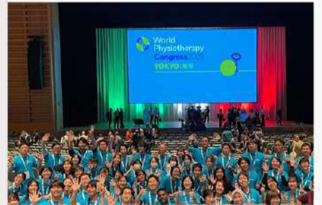
6月10日(火) リハビリテーション学科 活動報告