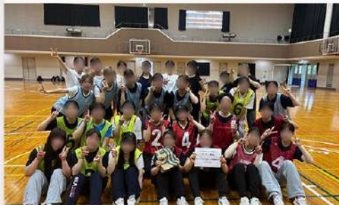
7月10日(木) 狭山キャンパス 学科間交流