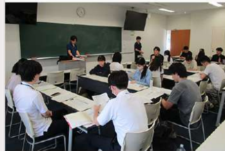
7月3日(木) 北区役所とのインターンシップ活動について