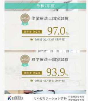
3月30日（月） リハビリテーション学科 国家試験結果速報！