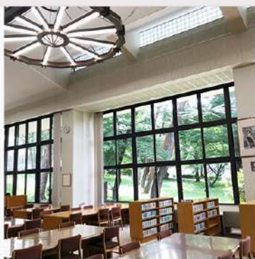
7月28日 (月) 狭山キャンパス 学内風景