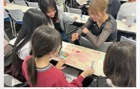
5月2日(金) 心理カウンセリング学科 授業見学会の様子(4月29日)