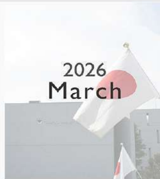
3月31日（火） 3月 Instagram Monthly ページ更新！