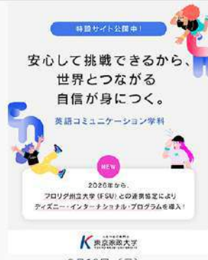
3月16日 (月) 心理カウンセリング学科 岡島 義 教授 「ほげ-たいそう」 監修報告