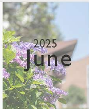
6月30日 (月) 6月 Instagram Monthlyページ 更新!