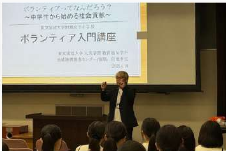
6月11日(水) 地域連携推進センター(板橋) ボランティア入門講座 実施報告