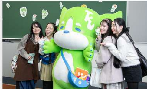
11月17日 (月) 緑苑祭 (板橋キャンパス) 実施報告