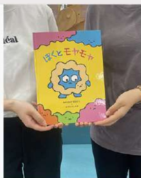
7月29日 (火) 児童学科 武田ゼミ+絵本作家 まえだよしゆき氏の共同制作 子どもに寄り添うこころの絵本『ぼくとモヤモヤ』完成報告