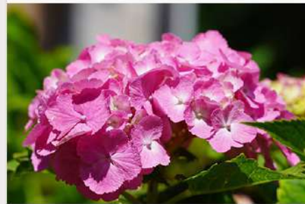
6月25日 (水) 板橋キャンパス 学内風景