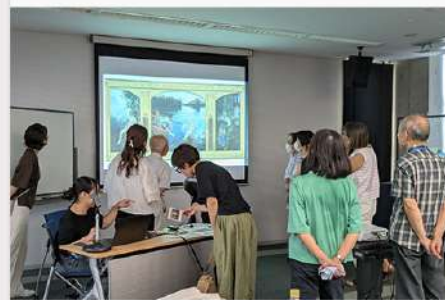
9月26日 (金) 北区中央図書館との連携企画紹介②