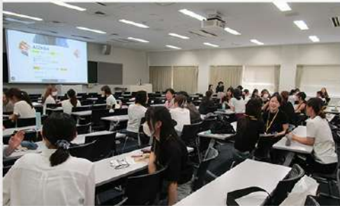
10月2日(木) マーケティング×起業×やりたいことが見つかる!? 講座 開催報告