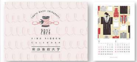
10月3日(金) ヒューマンライフ支援センター 「ピンクリボンカレンダー2026」発刊報告