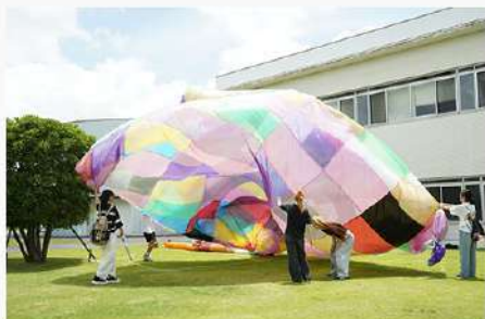
7月24日 (木) 全学共通教育科目「子どもと芸術B」 授業紹介