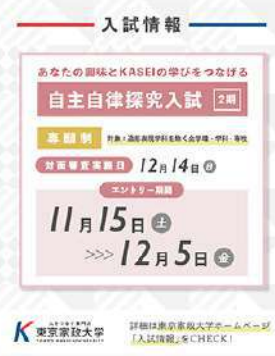
11月14日 (金) 2026年度入試情報