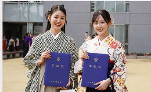
3月18日 (水) 令和7年度 学位授与式