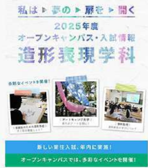
5月27日 (火) 造形表現学科 オープンキャンパス・入試情報特設サイトを公開中