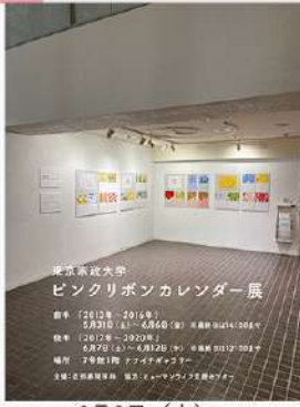
6月3日(火) ヒューマンライフ支援センター ピンクリボンカレンダー展 開催情報