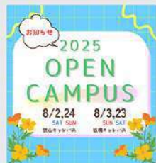
7月16日 (水) 8月 オープンキャンパス 紹介動画