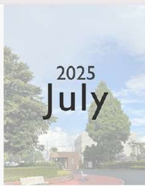
7月31日（木） 7月 Instagram Monthly ページ更新！