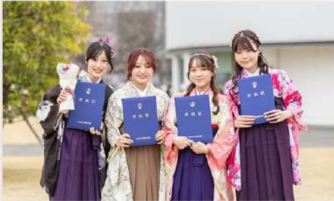
3月26日（木） 令和7年度 学位授与式