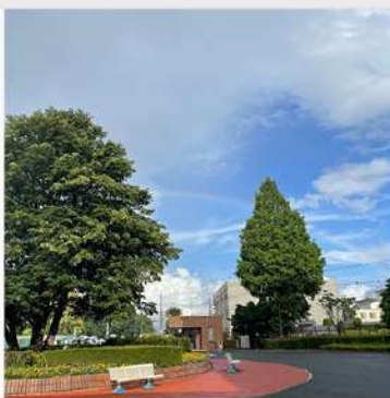
7月17日 (木) 狭山キャンパス 学内風景