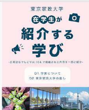
6月27日 (金) 広報誌なでしこVol.104の内容を一部ご紹介! ②