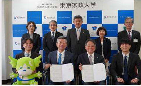
10月1日(水) 桜丘中学・高等学校との高大連携協定 締結報告