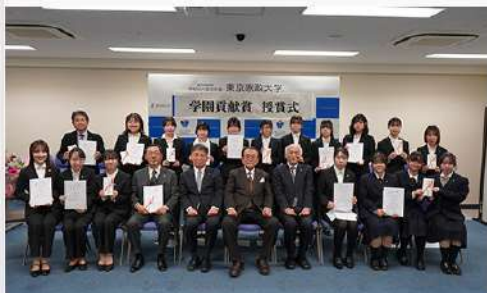
3月31日（火） 令和7年度学園貢献賞 開催報告