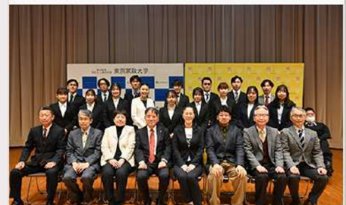
3月24日 (火) 北区とのインターンシップで制作した ショートフィルムの成果報告会を実施