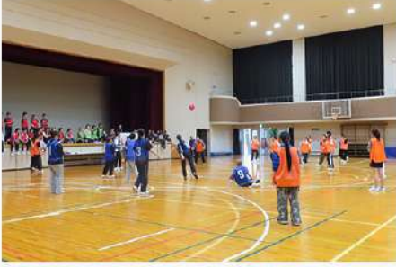
5月1日(木) 狭山キャンパス 令和7年度 第1回学科間交流会