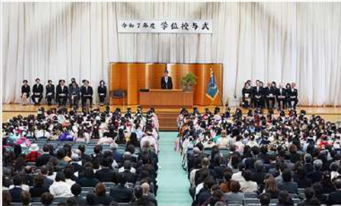
3月18日 (水) 令和7年度 学位授与式