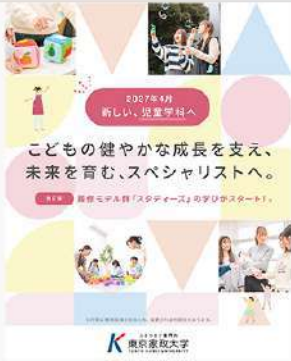
3月17日 (火) 児童学科 特設サイト公開