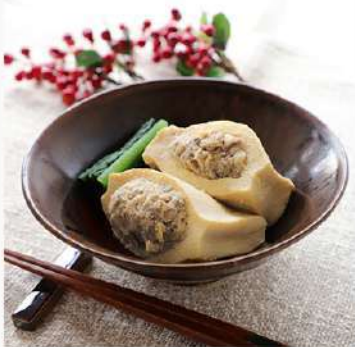
11月17日 (月) 株式会社ドクターズプラザとの産学連携事業紹介