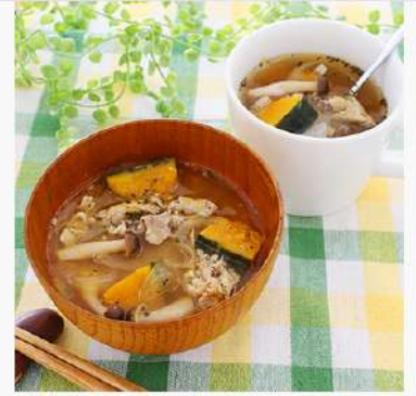
9月3日（水） 株式会社ドクターズプラザとの産学連携事業