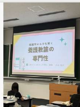
7月24日 (木) 心理カウンセリング学科 7月オープンキャンパス 当日の様子