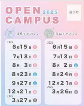
5月13日(火) 6月以降のオープンキャンパス日程