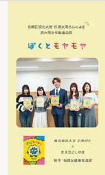
3月17日 (火) 児童学科 武田ゼミ子どもに寄り添うところの絵本「ぼくとモヤモヤ」 板橋観光大使 杉浦太陽さんによるメッセージ動画公開