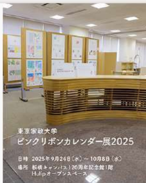
9月25日 (木) ヒューマンライフ支援センター ピンクリボンカレンダー展2025 開催!