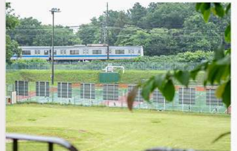
6月16日(月) 狭山キャンパス 学内風景