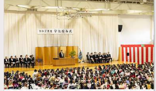
12月26日（木） 令和7年度 学位授与式