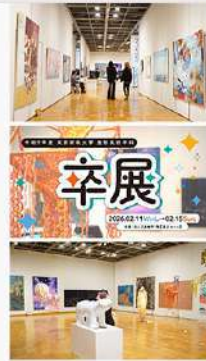
3月23日 (月) 造形表現学科 卒業制作展 動画公開