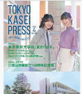
5月15日(木) Tokyo Kasei Press 広報誌なでしこ Vol.104 発刊報告