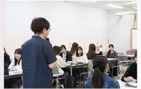
5月12日(月) 児童学科の授業「子どもの健康と安全」紹介