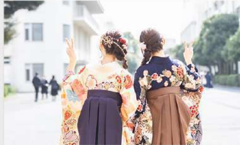
3月26日（木） 令和7年度 学位授与式