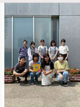
7月29日 (火) 児童学科 武田ゼミ 子どもに寄り添うこころの絵本 『ぼくとモヤモヤ』を用いた活動紹介