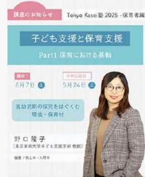
5月9日(金) Tokyo Kasei塾-保育者編 専門講座- 開講のお知らせ