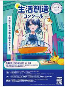
6月5日(木) 生活科学研究所主催 生活創造コンクールについて