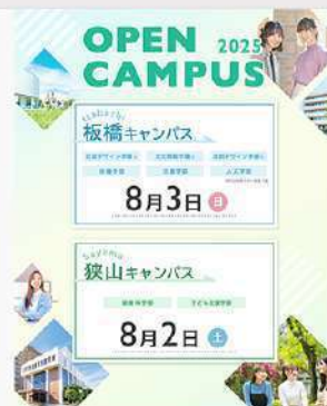
7月18日 (金) 8月 オープンキャンパス情報