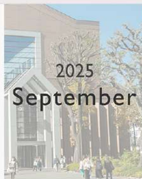
9月30日 (火) 9月 Instagram Monthly ページ更新!