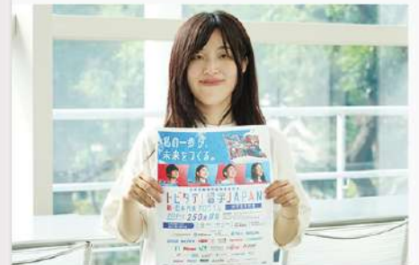
9月11日（木） リハビリテーション学科 作業療法専攻の学生が トビタテ！留学JAPANに内定