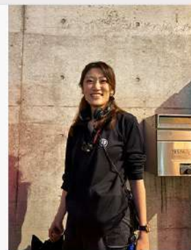
7月15日(火) 「ハリーポッターと呪いの子」演出部として活躍する 卒業生の紹介