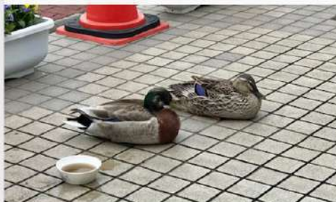
5月29日 (木) 東京家政大学 狭山キャンパス 学内風景