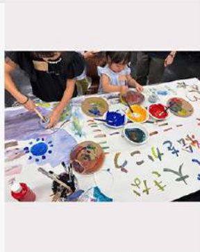
9月5日（金） 社会デザイン学環 なつやすみこども自由教室 開催報告