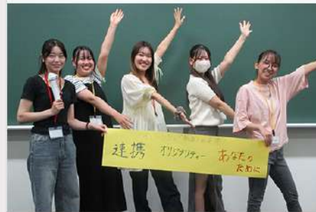
9月24日 (水) インスーンシップ事後プログラム開催報告