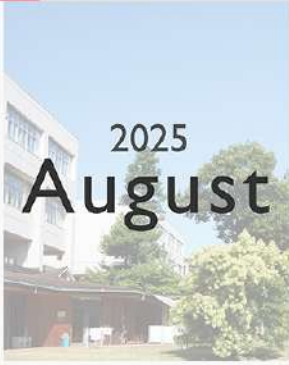
9月1日（月） 8月 Instagram Monthly ページ 更新！