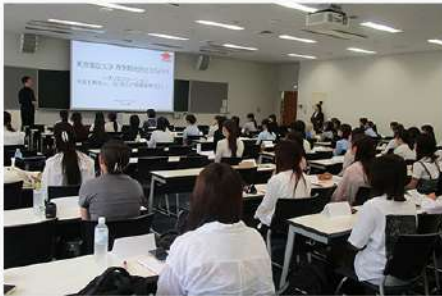
6月6日(金) キャリア支援 他大学合同就活ゼミの紹介