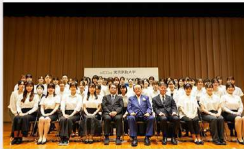
7月2日(水) 令和7年度 在学生特待生奨学金採用通知授与式 6月25日(板橋) / 6月26日(狭山)