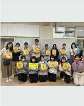
11月18日 (火) 児童学科 武田ゼミ 活動報告