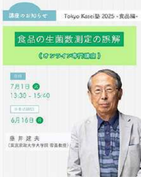
5月21日 (水) Tokyo Kasei塾2025-食品編- 開講のお知らせ