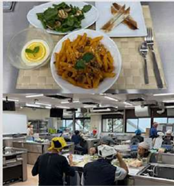
5月14日(水) 地域連携推進センター(板橋) 男の料理教室、再始動