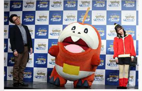
3月16日 (月) 英語コミュニケーション学科 特設サイト公開