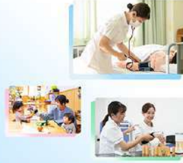
11月13日 (木) 狭山キャンパス特設サイト公開報告

東京家政大学の 人の一生を支える学び WITH Learning, With Love.