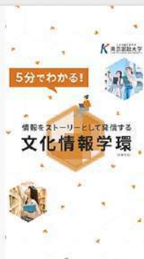
7月4日(金) 2026年4月新設 文化情報学環の学び紹介!