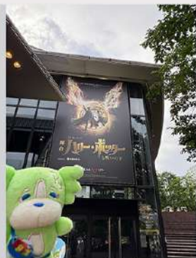
7月14日(月) 教養講座「ハリーポッターと呪いの子鑑賞」 開催報告