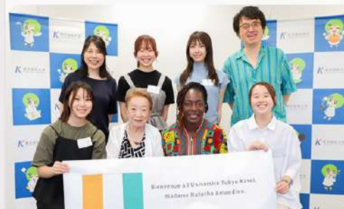
9月17日（水） アフリカコートジボワールの女史が来校 本学オープンキャンパスの視察と栄養学部学生と交流