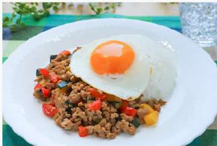
7月1日(火) 株式会社ドクターズプラザとの産学連携事業