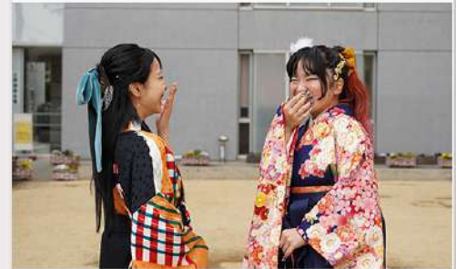
3月19日 (木) 学生広報 卒業生メッセージ