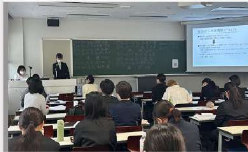
5月22日 (木) 東京家政大学大学院 臨床心理学専攻 修士論文中間発表会