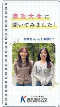
11月13日 (木) 在学生インタビュー動画公開