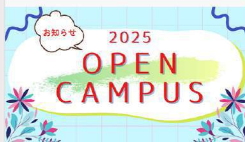
6月26日 (木) オープンキャンパス情報📢 (7月13日)