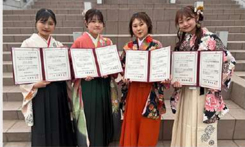
3月30日（月） 栄養学科 学生資格取得報告