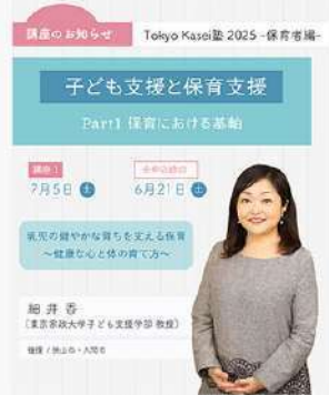
5月23日 (金) Tokyo Kasei塾2025-保育者編 専門講座- 開講のお知らせ