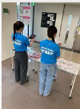
7月23日 (水) 7月オープンキャンパス 開催報告