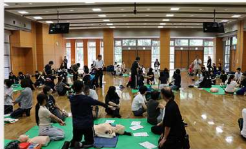
9月10日（水） 地域連携推進センター（板橋） 帝京大学「ELS研究会」と連携し、心臓蘇生体験講習を開催