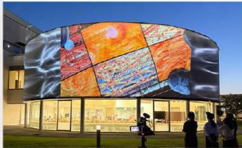
6月9日(月) 造形表現学科 映像メディアゼミ 活動報告