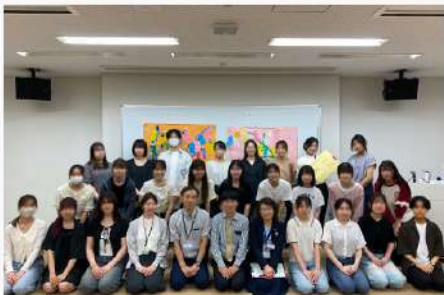
7月9日(水) 東京家政大学大学院 臨床心理学専攻 ×東京家政大学 心理カウンセリング学科の取り組み紹介②