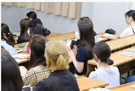
7月11日(金) 東京家政×昭和産業グループ たまごのある暮らしレシピ開発教育プログラム