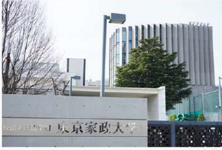
3月13日 (金) 140周年記念館 現状報告