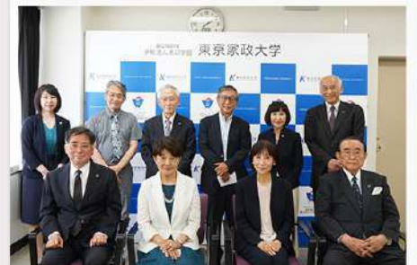
6月19日(木) 東京家政大学 名誉教授称号授与式 (6月12日)