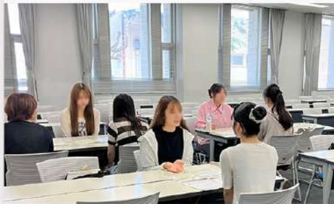
6月23日 (月) 6月 心理カウンセリング学科 オープンキャンパス