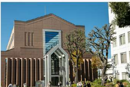
9月16日（火） 後期授業がスタートしました！