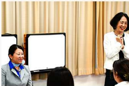
6月20日 (金) ANAエアラインフォーラム開催報告