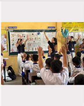
9月4日（木） リハビリテーション学科 カンボジアスタディツアー 実施報告