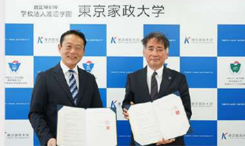
11月14日 (金) 貞静学園高等学校との高大連携協定 締結報告