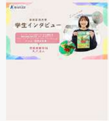
3月27日（金） 在学生インタビュー！ロングVer. 公開！