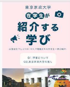
6月26日 (木) 広報誌なでしこVol.104の内容を一部ご紹介! ①