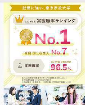
7月28日 (月) 「2025年実就職率ランキング」で全国女子大No.1!