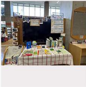
9月19日 (金) 北区中央図書館との連携企画紹介①