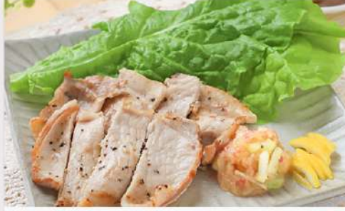
5月1日(木) 株式会社ドクターズプラザとの産学連携事業