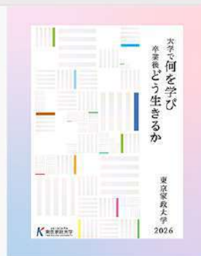
7月10日(木) 東京家政大学 大学案内2026 デジタルパンフレット公開中!