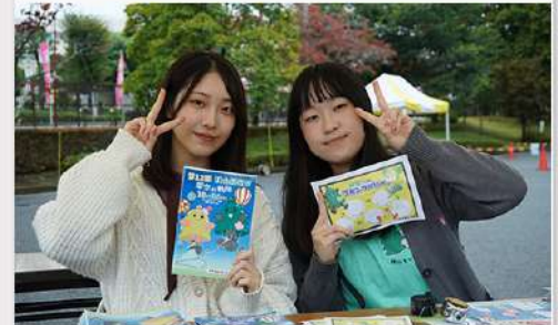
11月17日 (月) 緑苑祭 (狭山キャンパス) 実施報告