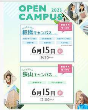
5月27日 (火) 東京家政大学 6月オープンキャンパス情報