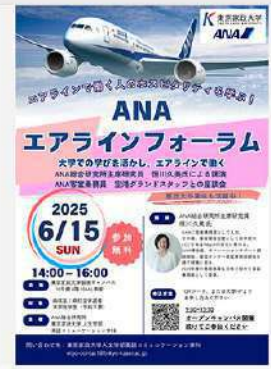
5月19日 (月) ANAエアラインフォーラム開催情報