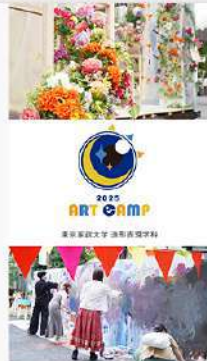
11月19日 (水) 造形表現学科 2025アートキャンプ動画公開