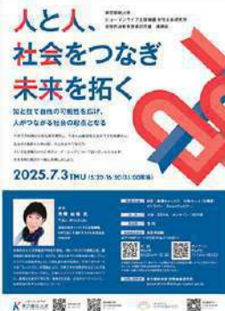
5月28日 (水) 女性未来研究所と全学共通教育推進部が 7月3日 (木) に講演会を開催します