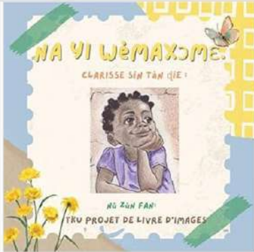
5月2日(金) 英語コミュニケーション学科 本の出版について