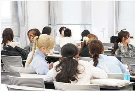
5月27日 (火) 1年生前期必修科目 「スタートアップセミナー 自主自律」紹介