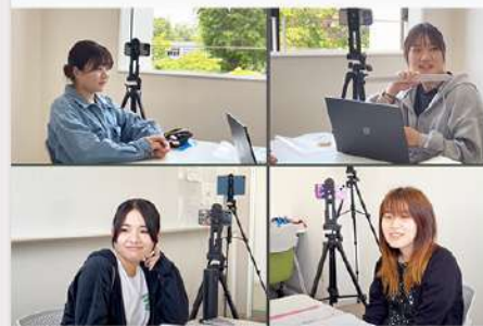
7月8日(火) リハビリテーション学科 三菱みらい育成財団 助成プログラムの活動報告