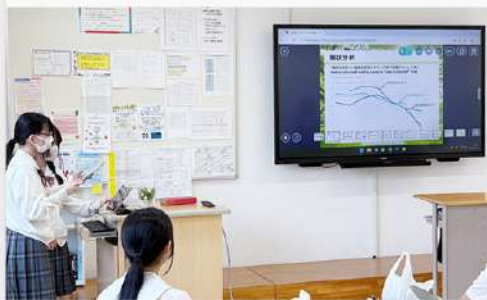
7月7日(月) 高大連携プログラム 取り組み紹介