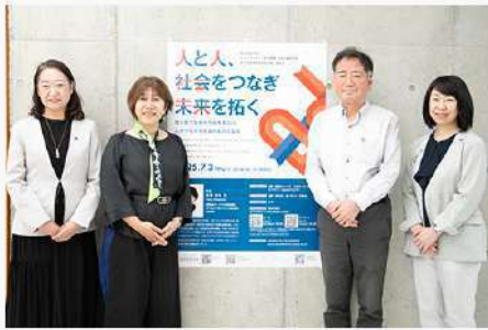
7月30日（水） 女性未来研究所 講演会 開催報告