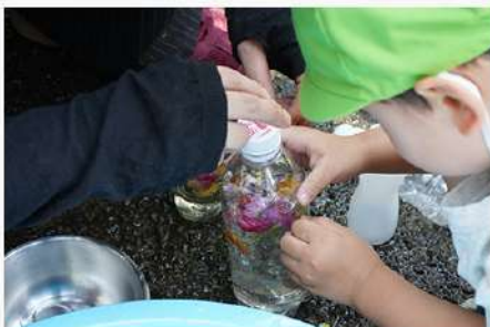
6月17日(火) 授業風景紹介