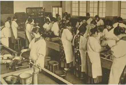
5月8日(木) 大学創立記念日(5月6日)