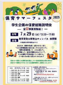
7月25日 (金) 学生企画の保育就職説明会「保育サマーフェスタ2025」 開催情報