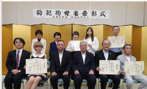
9月22日 (月) 板橋警察署/板橋防犯協会から感謝状を授与