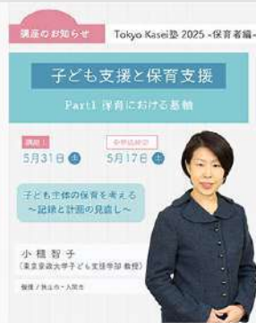
5月2日(金) Tokyo Kasei塾-保育者編 専門講座- 開講のお知らせ