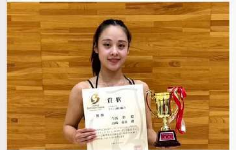
5月8日(木) 公認サークル 競技ダンス部の学生が優勝しました!