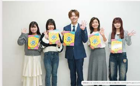
3月17日 (火) 児童学科 武田ゼミ子どもに寄り添うところの絵本「ぼくとモヤモヤ」 板橋観光大使 杉浦太陽さんによる読み聞かせ動画完成報告 (制作: 板橋区健康推進課)