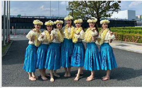
5月19日 (月) 公認フラサークルPuaLani活動報告