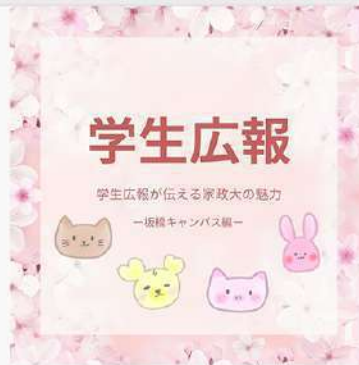
3月30日（月） 坂橋キャンパス 学生広報投稿