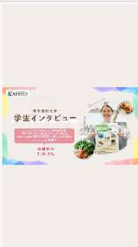
3月23日 (月) 在学生インタビュー! ログVer. 公開!