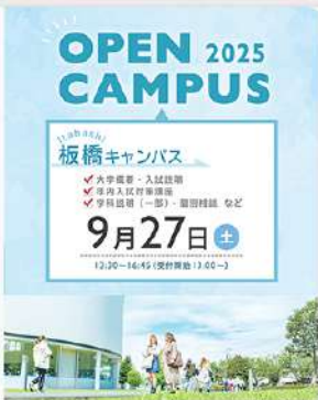
9月9日（火） 9月オープンキャンパス情報