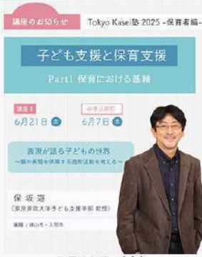
5月16日 (金) Tokyo Kasei塾2025-保育者編 専門講座- 開講のお知らせ