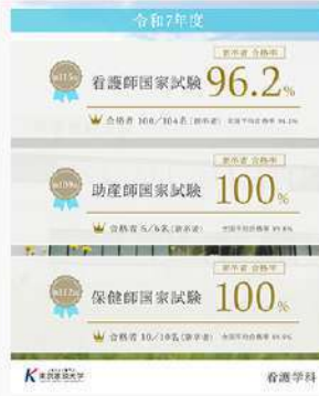
3月26日（木） 看護学科 国家試験結果速報！