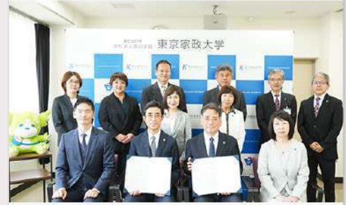
10月1日(水) 英明フロンティア中学校・高等学校との高大連携協定 締結報告