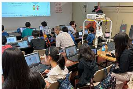
9月30日 (火) プログラミング講座 開催報告