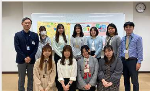
6月13日(金) 東京家政大学大学院 臨床心理学専攻と 東京家政大学 心理カウンセリング学科の取り組み紹介