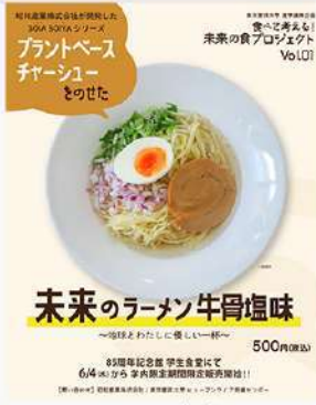
6月4日(水) ヒューマンライフ支援センター 食べて考える! 未来の食プロジェクト第1弾 開始