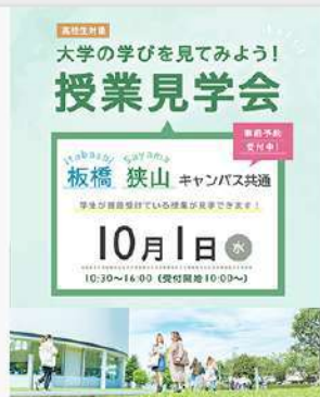
9月25日 (木) 新企画 -東京家政大学 授業見学会- 開催!