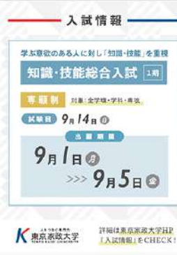
9月1日（月） 2026年度入試情報