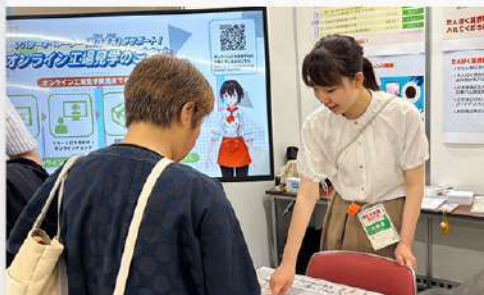
6月18日(水) 農林水産省主催「第20回食育推進全国大会」 学生参加報告