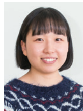
教育福祉学科 N.K.さん