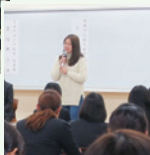
看護系職種 座談会